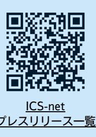
ICS-net プレスリリース一覧

メディア掲載情報 日本経済新聞電子版(7/12) / 日本食糧新聞(7/12) / みなと新聞(7/12) TECHABLE(7/20) / 日本経済新聞朝刊(7/13) / 日本食糧新聞(7/26)